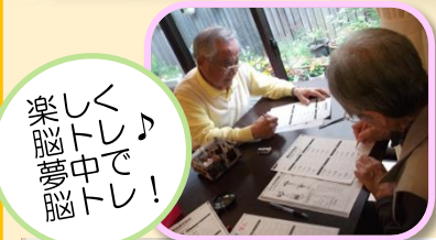
楽しく 脳トレ！ 脳トレ！ 脳トレ！