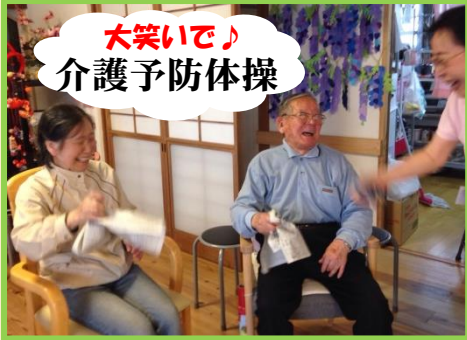
大笑いで♪ 介護予防体操