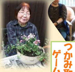
つかみ取り ゲーム