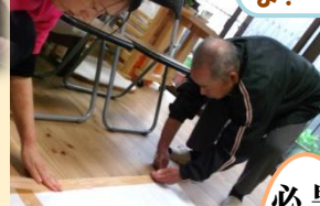
足が勝手に 動いて 気持ちいい よ！