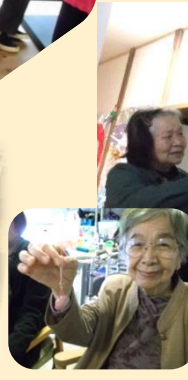
壁画：水芭蕉《遙かな尾瀬》