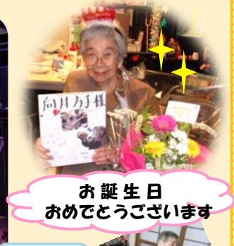
お誕生日 おめでとうございます