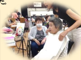
カラーコーディネート シャルWEシャル