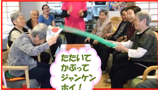
たたいてかぶってジャンケンホイ!