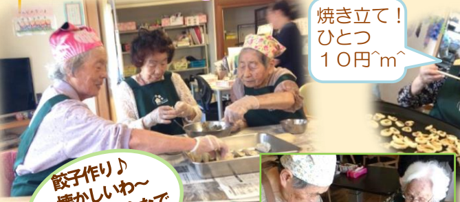
餃子作り♪ 懐かしいゆ〜よく家族みんなで包んだものよ。