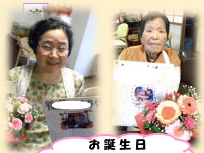
お誕生日おめでとうございます