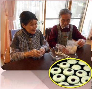
ペビーカステラ作り

寒さが厳しくなるこの時期は お正月遊びやおやつ作りを楽しむとともに、 室内での体操などで体を動かしました。