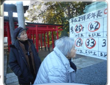
気になりますね...厄年