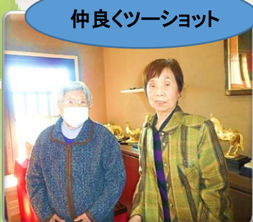
仲良くツーショット