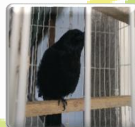
秋葉神社のカラス