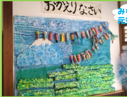
みなさまのこいのほり 元気におよんでいます♡