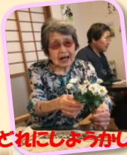
どねにしようかしら♡