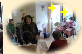
シルバーロマンさんの演奏 に合わせて、歌います♡