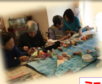
5月の壁画は 【こいのほり】 富士山とお茶 畑を背に♪