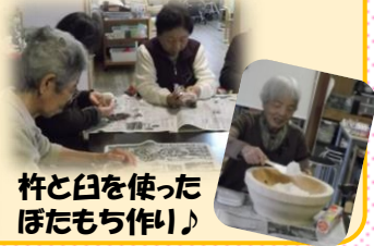
杵と臼を使った ぼたもち作り♪