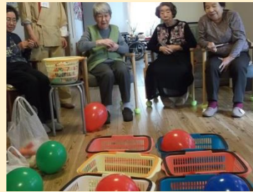
はねる風船に、 皆様真剣勝負★