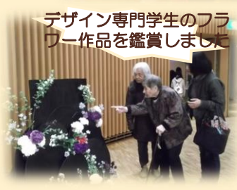
デザイン専門学生のフラ ワー作品を鑑賞しました