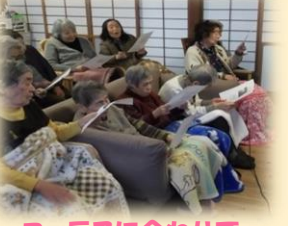
コーラスに合わせて 体を動かしました♪