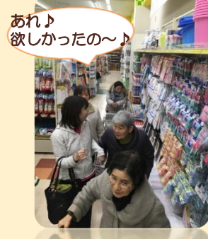
あれ♪ 欲しかったの～♪