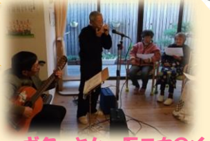
ギターとハーモニカのメ ロディにのせて…♪ みなさまで歌いました♪