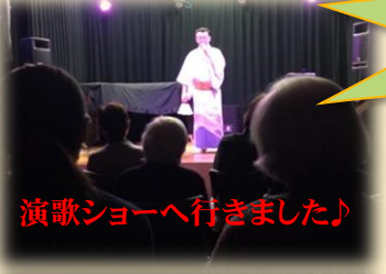
演歌ショーへ行きました♪