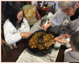
♡おやつ♪ 大学芋作り♡