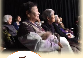
喫茶店で コーヒタイム♪