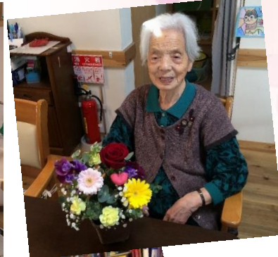
園芸福祉 バレンタインアレンジ