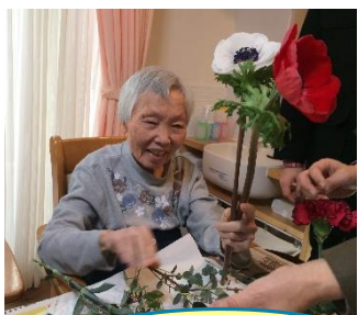
いっにおいでしょ?