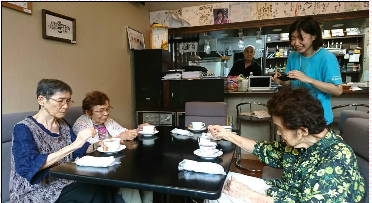
今年も清水の七夕祭りに行ってきました (「GINZAシャル」で、のんびりコーヒータイム)