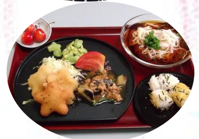
美穂の家の「七夕御膳」