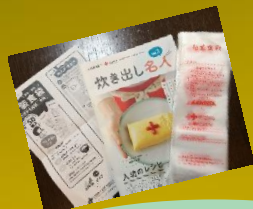
調理シク 防災飯・栗どら焼き作り