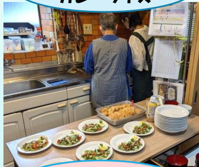
おしゃれなランチ 完成!