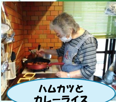
ハムカツと カレーライス